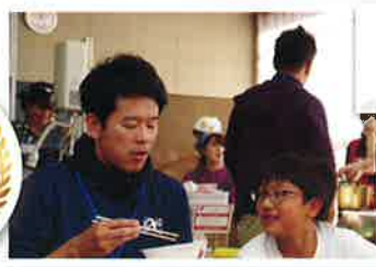
とりで (山口県岩国市)

「子ども食堂」や「学習支援」などの居場所づくりを通して、他人を頼ることで「子育て」だって休んでいいと思えるような文化を地域に根付かせることを目的に「子育て支援」の活動を行っている。