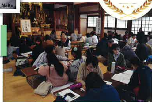
ぎふ学習支援ネットワーク (岐阜県岐阜市)

地域で子どもの貧困問題に取り組む様々な団体がネットワーク化して活動。子ども達が未来に希望をもてる社会を作るため、自治体や様々な機関と連携して、交流や研修会、新たな学習支援実施団体の立ち上げ支援や、貧困問題の解消に向けた行政への提言なども行う。