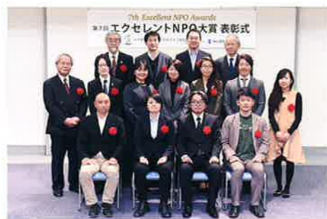
※第7回表彰式受賞団体集合写真

応募受付・審査進行管理:「エクセレントNPO」をめざそう市民会議事務局 〒103-0013 東京都中央区日本橋人形町3-7-6 LAUNCH日本橋人形町ビル5階 言論NPO内 Tel. 03-3527-3972(平日9時30分～17時30分受付) Fax. 03-6810-8729(24時間受付) お問い合わせ用メールアドレス( enpo@genron-npo.net )