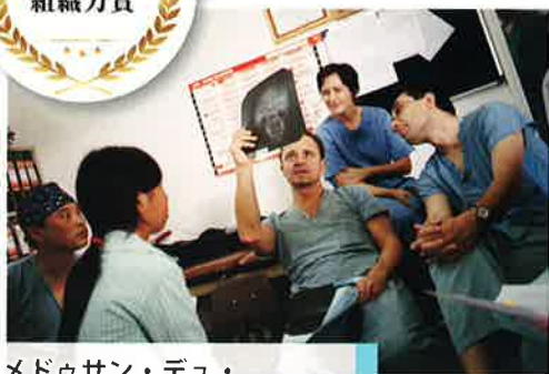
メドゥサン・デュ・モンド ジャパン (東京都港区)

「誰もが治療を受けられる未来を」をモットーに世界各地で人道医療支援を行う国際NGO。国籍や人種、宗教などのあらゆる壁を越え、弱い立場にある人々のもとに医療・保健・衛生分野の専門家ボランティアらを派遣。現地医療従事者の自立支援から問題解決のための政策提言も行う。