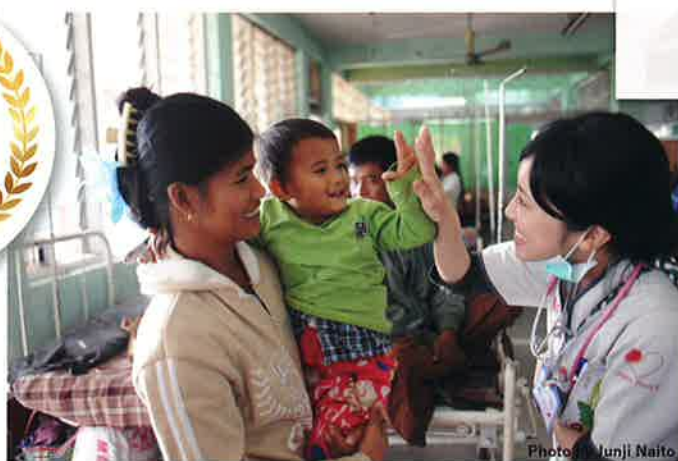
ジャパンハート (東京都台東区)

「医療の届かないところに医療を届ける」をミッションに掲げ活動する、日本発祥の国際医療NGO。毎年700名以上のボランティアがミャンマー、カンボジア、ラオスで医療活動を行い、年間約2万件の治療を実施。日本国内の僻地離島への看護師派遣、小児がんの子どもと家族の外出支援、災害時の緊急支援にも取り組む。