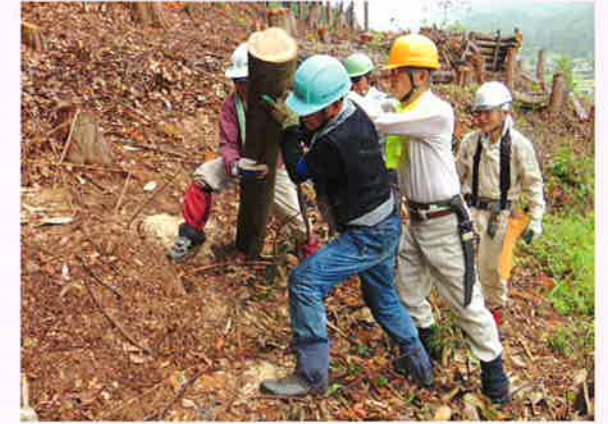
NPO法人 里野山家(兵庫県)