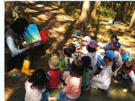
NPO法人 大杉谷自然学校(三重県)

※自然の生態系の保護を優先すべき地域や、学校・庁舎などの敷地における活動は対象外です。