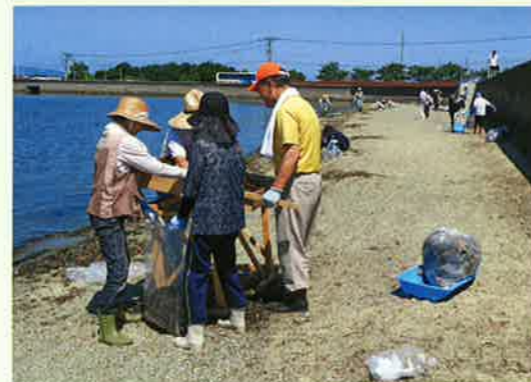
大村明社会(長崎県)