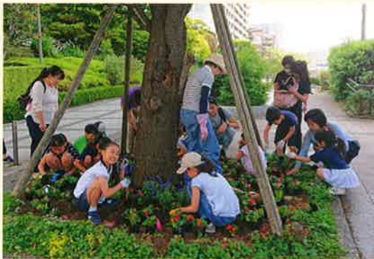
パークシティ豊洲園芸クラブ(東京都)