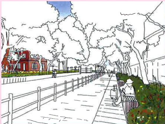
第30回 国土交通大臣賞 東京藝術大学キャンパスランドデザイン推進室

地域のシンボリックな緑地として人と自然が共生する都市環境の形成、地域の活性化に寄与するプランを募集します。