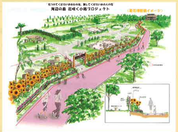
第30回 コミュニティ大賞 NPO法人森の会