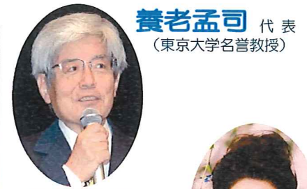
養老孟司 代表 (東京大学名誉教授)