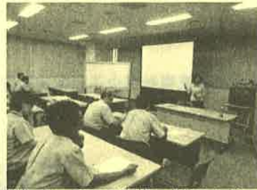
(写真は「株式会社金沢村田製作所」様での実施の様子です)

主に働くお父さんを対象とした子育て講座（子育ての楽しさや大切さ、子どもとの接し方などをテーマにしています）を開催していただける企業・団体等を募集しています。