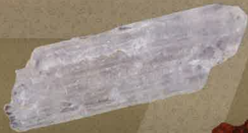
硝石：黒色火薬の原料