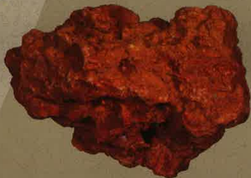
ボーキサイト：アルミニウムの原料