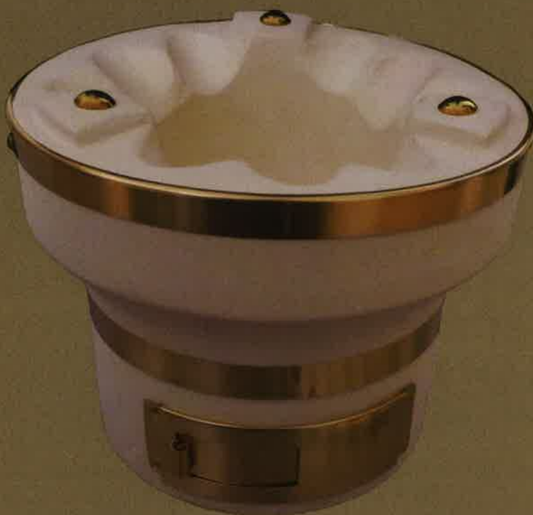
珪藻土で作られた七輪