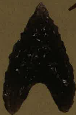
黒曜石で作られた鎌（やじり）