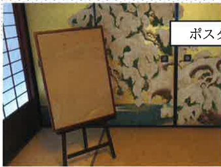
ポスター展示会場のイメージ

ポスターには、団体の得意なこと やマッチングしたいこと、これからの 取り組みなどがPRされます！