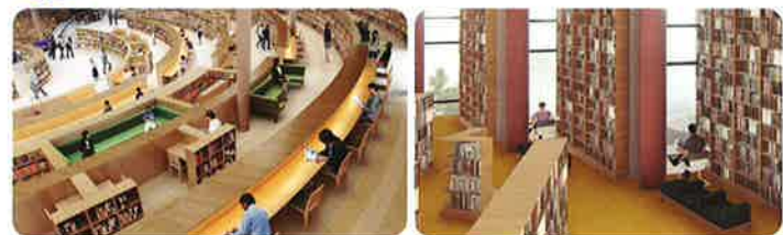
閲覧席は約500席を設けます。ゆったり読書を楽しむソファ席、読書に没頭できるデスク席、自習やグループ学習に利用できる学習席、外を眺める窓際の半個室の席など、その日の気分でお好きな席に。