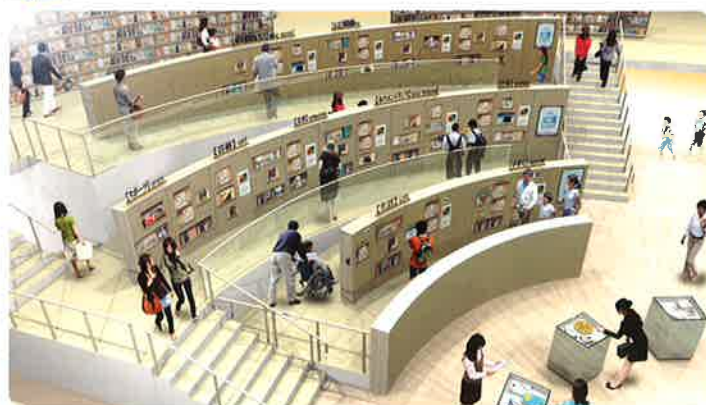
利用者の関心の高いテーマごとに図書を並べることで、思いがけない出会いを演出します。館内をめぐりながら、本との出会いを楽しんで。