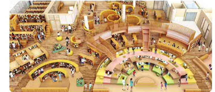
広さは現図書館の約5倍。図書館に来ること自体が楽しみになるような「あそび場」を思わせるエリアです。独立したエリアなので、ちょっと騒いでも大丈夫。赤ちゃんと一緒にどうぞ!