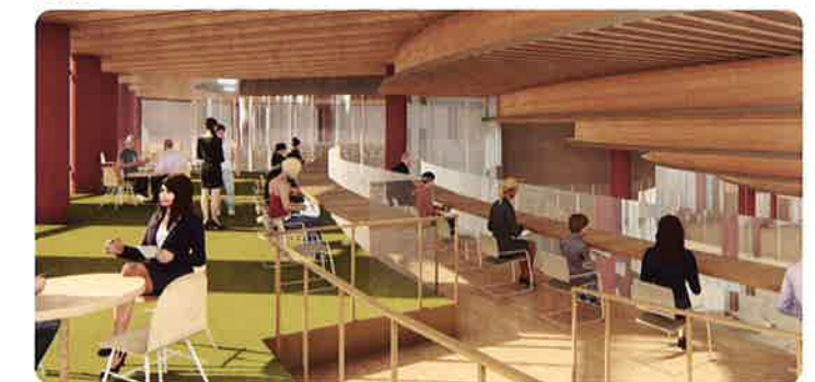
眺めのいい場所で、自習、デスクワーク、グループ活動など自由に利用できます。