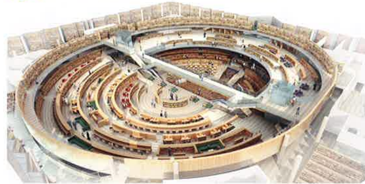
開放的な吹き抜けの周りを書架が取り囲む閲覧空間は、まるで円形劇場のよう。