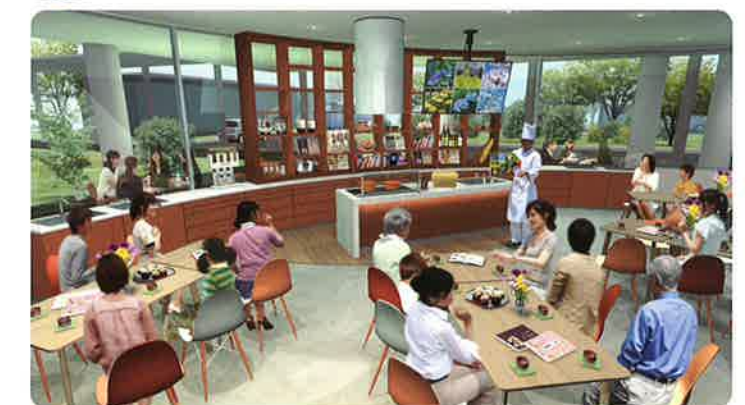
キッチン付きのイベントスペース。食に関するイベントはもちろん、他のイベントでも使えます。