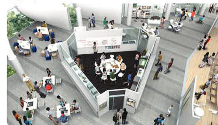
3Dプリンターやレーザーカッターなどを設置。読書で得た知識やデザイン、アーカイブの情報を利用して、すぐにその場でものづくり!