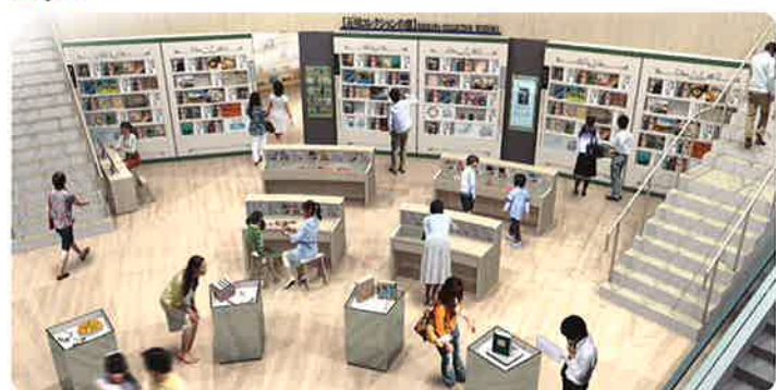
石川県が誇る多彩な伝統文化や豊かな里山里海に関する図書・資料等(石川コレクション)に触れれば、今まで知らなかった石川の魅力にきっと気付ける。