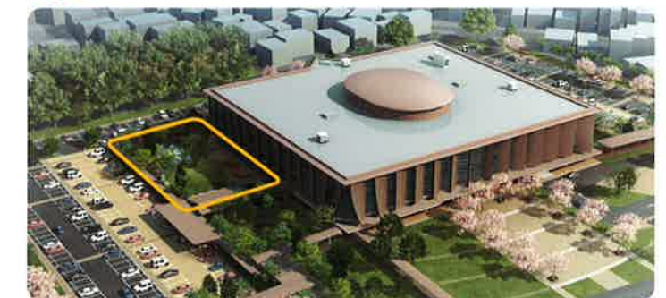
「こども向けエリア」専用の里山をイメージした屋外エリアでは、耕作や観察会などの体験ができます。さらには自然に囲まれながら読書ができる空間も併設。