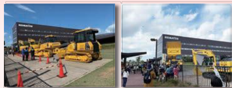
写真は昨年の様子です。

年に1度のビックイベント、今年も開催決定! 普段はなかなか近くで見ることができない建設機械がこまつの杜に大集合するよ! 詳しい内容は3月下旬~ 4月上旬までにこまつの杜のホームページでお知らせするのでチェックしてね。