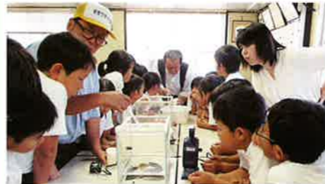
ホタル育成・観察(9/25～11/27) (NPO金沢杜の里事務所)