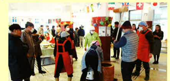
国際交流会館文化祭(餅つき)(1/13)