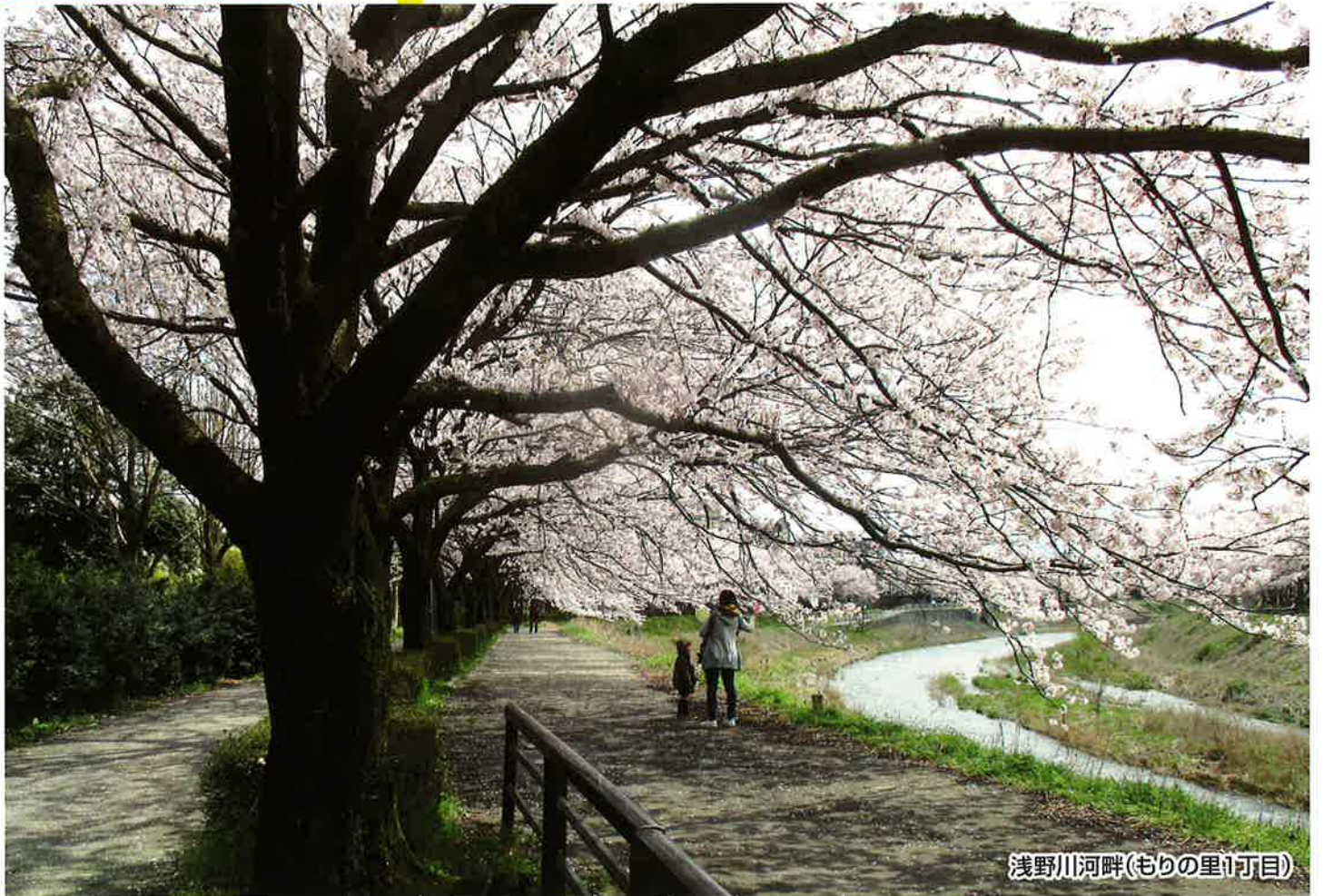
浅野川河畔(もりの里1丁目)