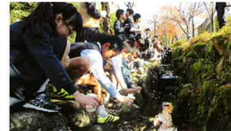
ホタル放流(11/28)(せせらぎ水路)