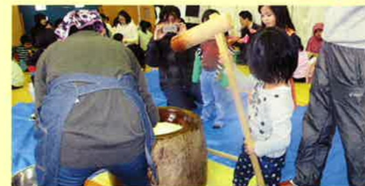
杜の里児童館餅つき大会(11/25)