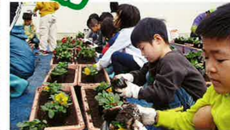
花苗(パンジー)植付け(11/11)