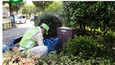
緑地小公園除草(毎月)