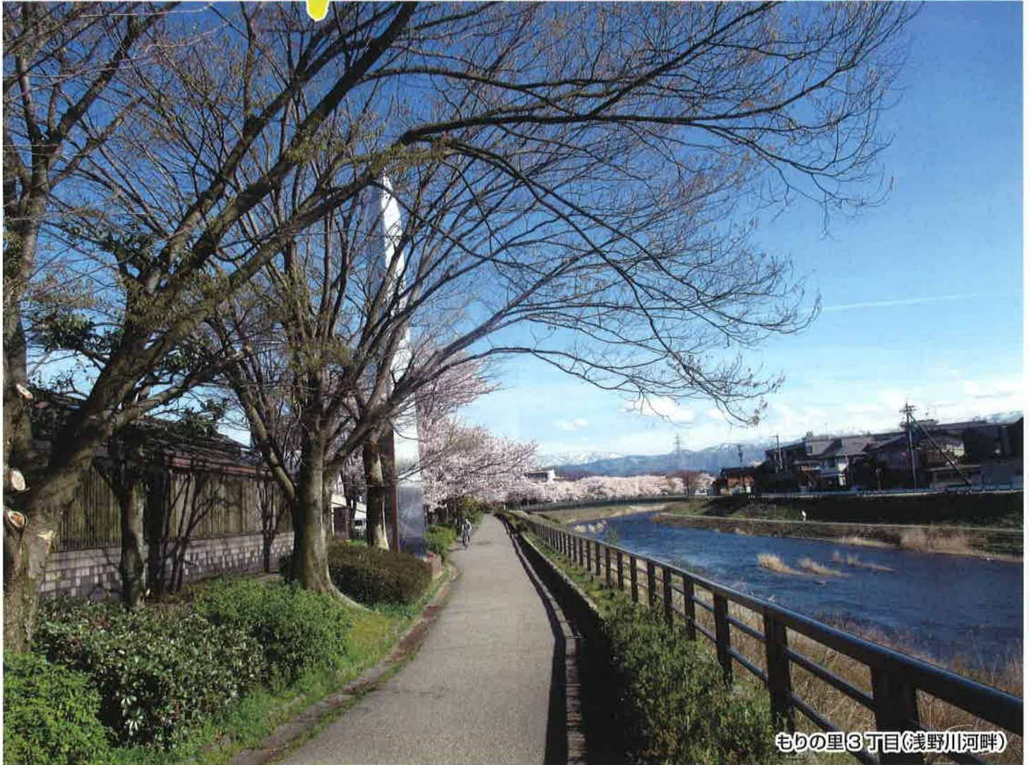
もりの里3丁目(浅野川河畔)