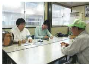
金沢大学生取材(5月7日)