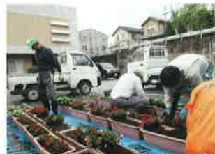
花苗の植付け(第2回・5月7日)