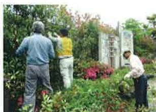
杜の里小公園剪定(5月28日)