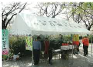
2016杜の里まつり出店(4月9日)