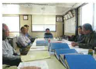
平成28年度会計監査(5月8日)