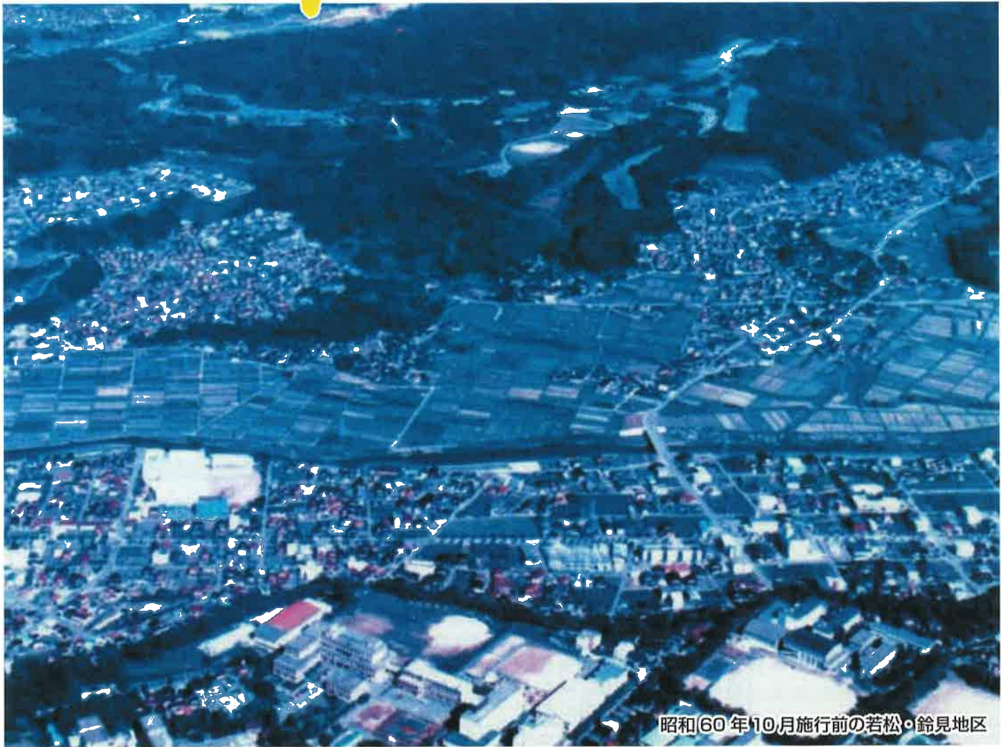
昭和(60)年10月施行前の若松・鈴見地区