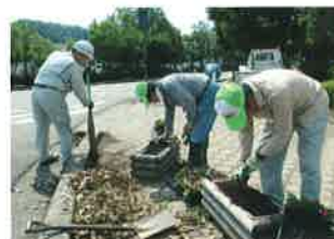
花苗の植付け(第3回・6月18日)