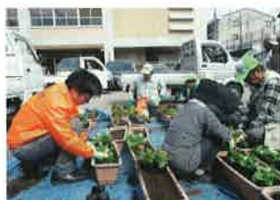
花苗の植付け(第1回・4月1日)