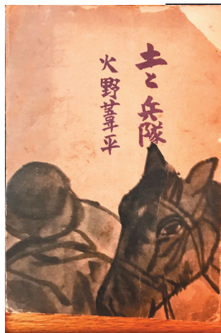
火野葦平『土と兵隊』初版本