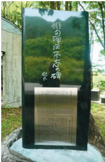
←俳句の弾圧不忘の碑